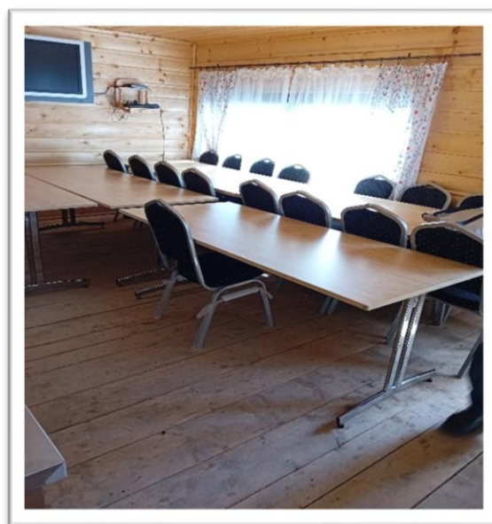
2.) Remont pomieszczeń Gminnego Ośrodka