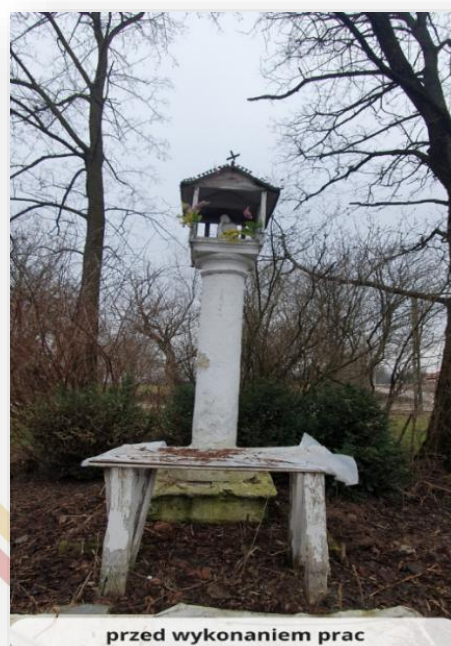
przed wykonaniem prac

2. W 2024 roku Gmina Raławice pozyskała dofinansowanie w ramach konkursu dla jednostek samorządu terytorialnego na prace konserwatorskie i restauratorskie lub roboty budowlane przy zabytkowych kapliczkach na zadanie pn. „Prace konserwatorskie i renowacyjne zabytkowej kapliczki z figurą Chrystusa Frasobliwego w