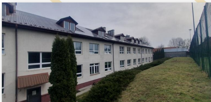
Szkoła Podstawowa przed Remontem