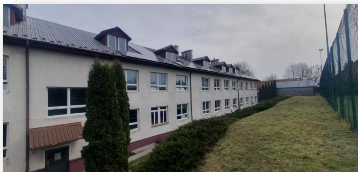
Szkoła Podstawowa po remoncie

Koszt remontu wyniósł 3 195 312,33zł. Na remont gmina uzyskała dofinansowanie z Rządowego Funduszu Polski Ład. Kwota promesy inwestycyjnej wyniosła 2 612 599,95 zł.